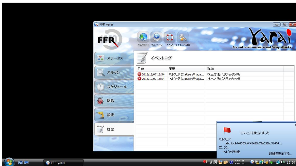
【FFR yarai 検知画面】

検証結果は、画面キャプチャのとおり、FFR yarai および FFRI プロアクティブ セキュリティの 5 つのヒューリスティックエンジンの中のマルウェアの静的解析を担う Static 分析エンジンがマルウェアを検知してシステムを保護しています。