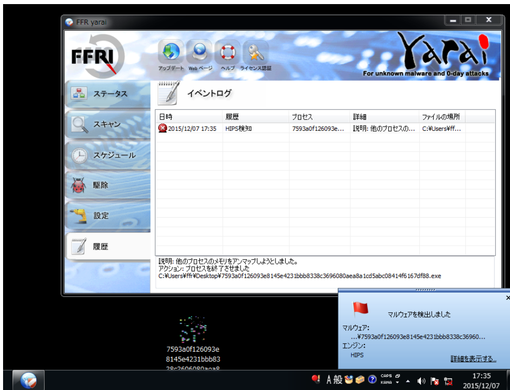
【FFR yarai 検知画面】

検証結果は、画面キャプチャのとおり、FFR yarai および FFRI プロアクティブ セキュリティの 5 つのヒューリスティックエンジンの中のマルウェアの動的解析を担う HIPS エンジンがマルウェアを検知してシステムを保護しています。