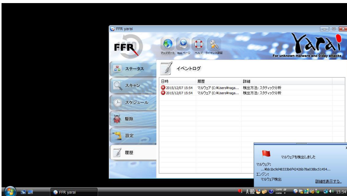
【FFR yarai 検知画面】

検証結果は、画面キャプチャのとおり、FFR yarai および FFRI プロアクティブ セキュリティの 5 つのヒューリスティックエンジンの中のマルウェアの静的解析を担う Static 分析エンジンがマルウェアを検知してシステムを保護しています。